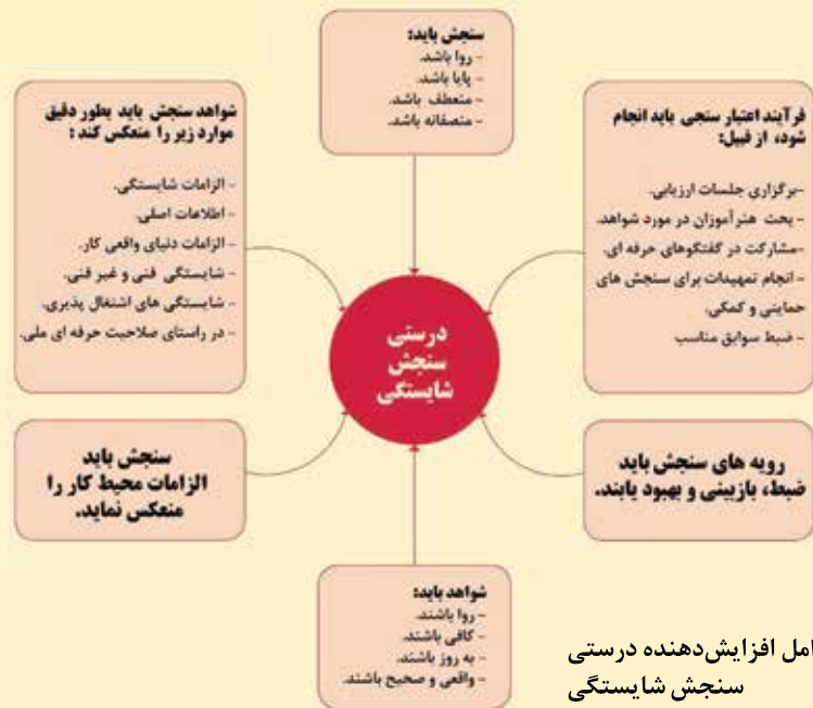
عوامل افزایش دهنده درستی سنجش شایستگی

و تحلیل نظام‌دار شواهد درباره میزان دستیابی یادگیرنده به مراتبی از شایستگی یا نتایج یادگیری، به منظور قضاوت و تصمیم‌گیری درباره ارتقای هنرآموزان به پایه یا دوره بالاتر صورت می‌گیرد. اما آنچه در ارزشیابی پیشرفت تحصیلی شایستگی محور اتفاق می‌افتد، جمع‌آوری و تحلیل نظام‌دار شواهدی از دستیابی یادگیرنده به مراتبی از شایستگی در فرایند تربیت در طول دوره/سال تحصیلی است که برای قضاوت در مورد ارزش آن‌ها براساس ملاک‌ها و سطوح عملکرد تعیین شده در هدف‌ها به منظور اصلاح و هدایت یادگیری/ارتقای آنان به پایه‌ها/دوره‌های تحصیلی بالاتر صورت می‌گیرد. رعایت استانداردها عملکرد تکالیف کاری به‌عنوان نتیجه فرایند یاددهی - یادگیری تلقی می‌شود. برخی از نتایج باید در دنیای کار (کارآموزی) ارزشیابی شوند.